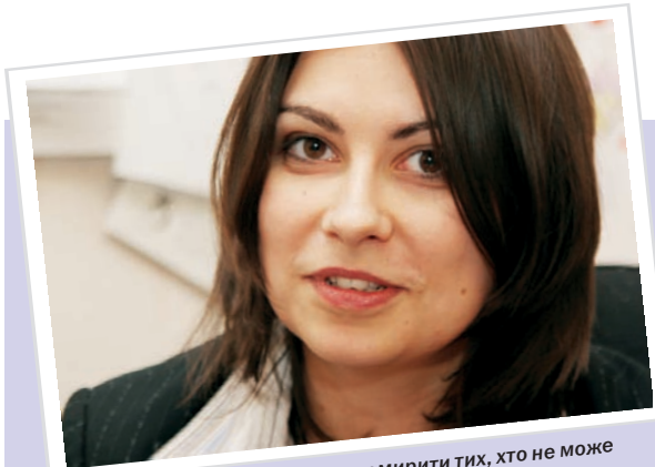
А ще я часто намагаюся помирити тих, хто не може порозумітися навколо мене