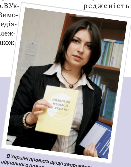
В Україні проекти щодо запровадження відновного правосуддя (медіації) в правову систему здійснює Український центр порозуміння спільно з регіональними партнерами