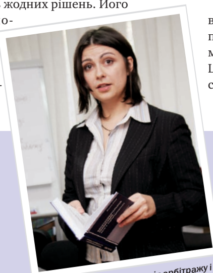
Медіація відрізняється від арбітражу і переговорів тим, що це процес, у якому третя нейтральна сторона допомагає сторонам у конфлікті досягнути взаємної згоди

– Термін «відновне правосуддя» походить від англійського словосполучення «restorative justice». Однак за ним не приховується якийсь конкретний метод чи техніка. Це швид-