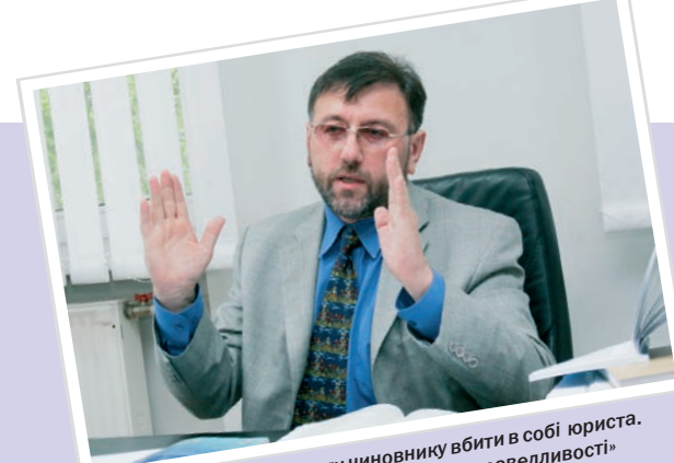
«Порада одна: не дати чиновнику вбити в собі юриста. Індикатор – наявність відчуття справедливості»