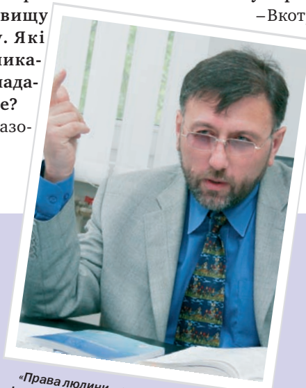
«Права людини – це алгоритм свободи. І ще це сфера, до якої втручання держави або взагалі не допускається, або жорстко регламентується суспільством в інтересах самого ж таки суспільства, звісно, якщо воно дійсно демократичне»