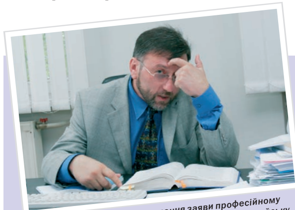
«...краще довірити складання заяви професійному юристові, але тільки тому, хто дійсно знає Європейську конвенцію та практику її тлумачення і застосування через рішення Суду»