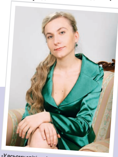
«У всьому світі, як і в Україні, спостерігається «спеціалізація практичної юриспруденції». Потреба юристів загальної практики відходить на другий план»