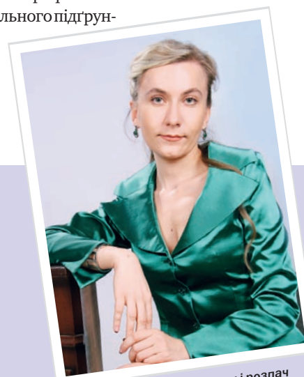
«Ми зустрічаємо сльози і розпач близьких, біль втрати, страждання, саме тоді й ми – адвокати – «лікарі душі»

– Відповідно до ч. 2 ст. 286 ЦК України забороняється вимагати та подавати за місцем роботи або навчання інформацію про діагноз та методи лікування