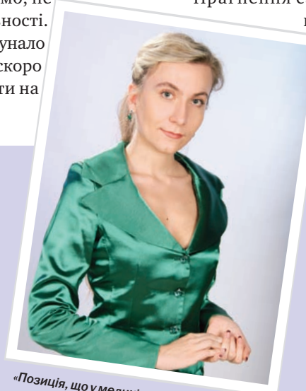
«Позиція, що у медиків лише обов'язки, а в пацієнтів – права, є хибною»