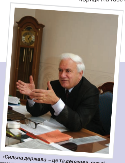
«Сильна держава – це та держава, яка діє демократичними засобами, але ці засоби не виключають і розумний примус»