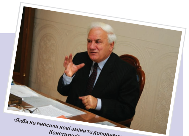
«Якби не вносили нові зміни та доповнення в 2004 році, Конституція могла би діяти»