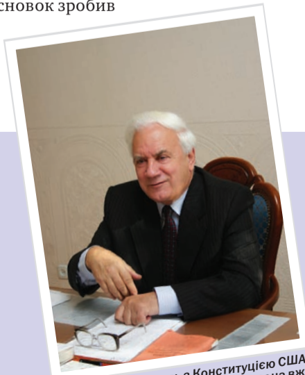
«Проведу паралель з Конституцією США – на неї часто посилаються, але вона вже абсолютно застаріла, це анахронізм»

Спілкувався СЛАВК БІГУН «Юридична газета»