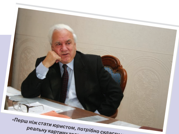
«Перш ніж стати юристом, потрібно скласти уявлення про реальну картину того, чим будеш займатися»