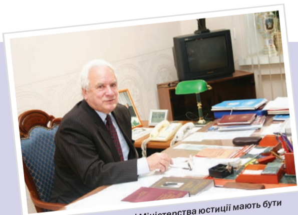
«В основу діяльності Міністерства юстиції мають бути покладені наукові підходи»

■ Але при прийнятті нової Конституції за умов перманентного протисто-