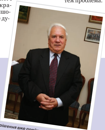
«А от коли рішення вже прийнято, то на нас, учених, тиснуть ті, хто хоче це рішення обґрунтувати...»