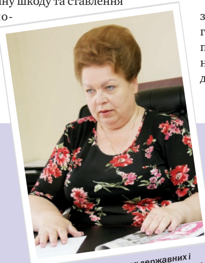
Зрівняння в правах державних і приватних нотаріусів – це лише одна із складових реформування нотаріату України

фесійних обов'язків, порушення конституційного права громадян на заняття професією та створення умов для зловживань і корупційних діянь при реєстрації нотаріальної діяльності, відсутність єдиного прозорого та принципового підходу до вирішення питань допуску до нотаріальної професії, суттєві недоліки в питаннях оподаткування доходів приватних нотаріусів, відсутність професійного самоврядування нотаріусів тощо.