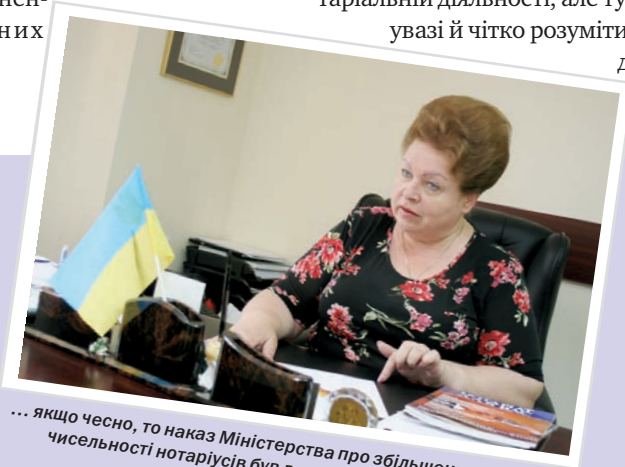
... якщо чесно, то наказ Міністерства про збільшення граничної чисельності нотаріусів був для нас дещо несподіваним

З огляду на такі повноваження Мін'юст забезпечує єдиний підхід до вимог з організації нотаріальної діяльності та єдину практику з вчинення нотаріальних дій.