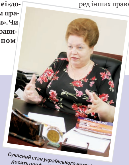
Сучасний стан українського нотаріату – досить професійний, але не завжди організований