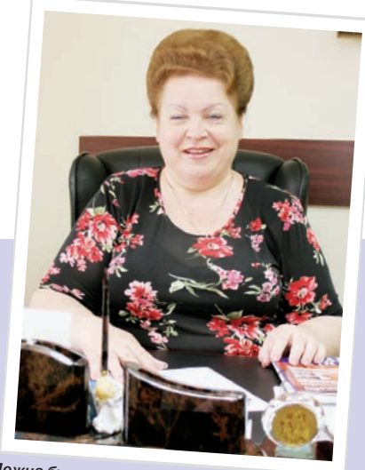
Можна буде розглядати нотаріат латинського типу як оптимальний компроміс між передачею нотаріату основних для правової системи завдань публічної влади і виконанням цих завдань вільним, висококваліфікованим ... професійним нотаріатом

– Вимоги до робочого місця приватного нотаріуса були затверджені ще в 1998 р., тобто з урахуванням