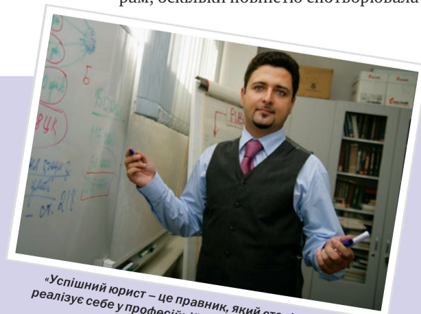
«Успішний юрист – це правник, який стовідсотково реалізує себе у професійній діяльності, забезпечуючи собі гідний рівень життя...»