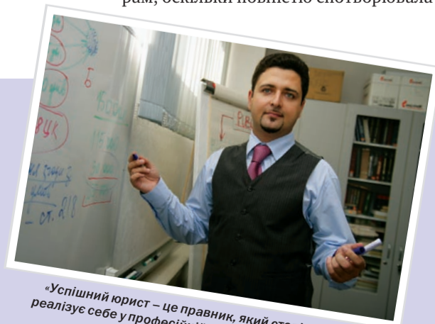
«Успішний юрист – це правник, який стовідсотково реалізує себе у професійній діяльності, забезпечуючи собі гідний рівень життя...»