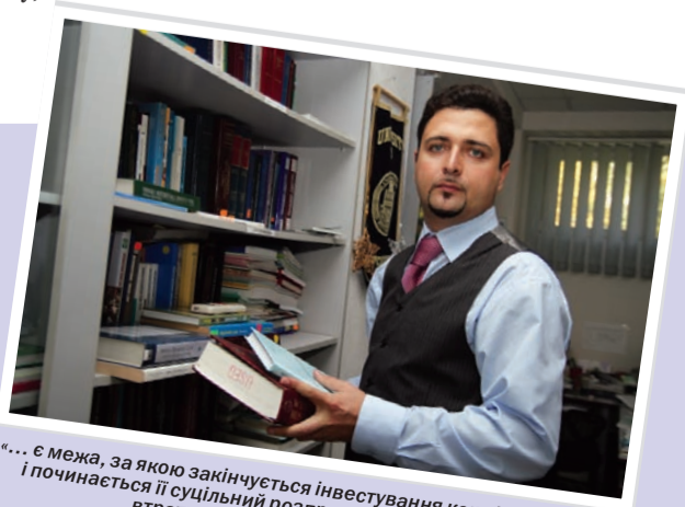
«... є межа, за якою закінчується інвестування коштів в економіку і починається її суцільний розпродаж, що може призвести до втрати економічного суверенітету...»