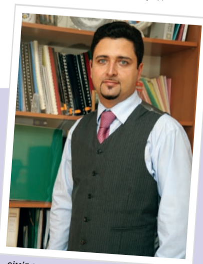
«...сім'я є важливішою за кар'єру; здоров'я є більш пріоритетне, ніж гроші...»