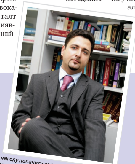
«...я мав нагоду побачити той стандарт юриста, який у нас часто іменують «світовим»: це такий собі «універсальний солдат», правник, що глибоко знає теорію права, економіку, вільно володіє кількома мовами»

відповідальності за свої дії. Вітчизняні юристи наввипередки підвищують тари- фи за свої послуги, встановлюючи оплату погодинно – «як у них там, за кордоном», але здебільшого абсо-