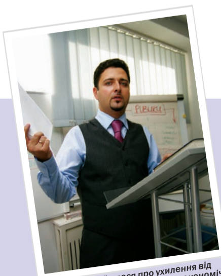
«І тут не йшлося про ухилення від оподаткування, а радше – про економічну неефективність...»

Спілкувався Славик БІГУН «Юридична газета»