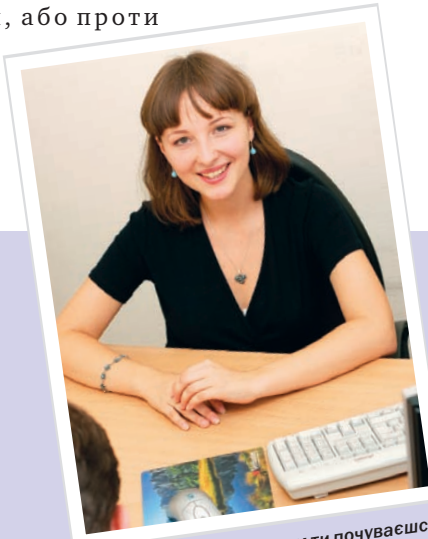
«Чим менш безпорадним ти почуваєшся на робочому місці, тим якіснішу освіту ти здобув»

– Вони прийняли підхід: «ти або з нами, або проти»