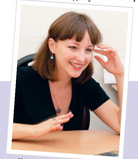
«Мрію, коли вже у нас, як у Голландії, наприклад, створять єдину базу всіх коли-небудь зданих студентами робіт. Завдяки їй викладач може легко визначити дійсного автора роботи, і студента очікують доволі серйозні санкції, аж до відрахування»

– Ваша ставлення до запровадження поза університетського іспиту на здобуття кваліфі-