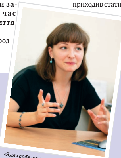
«Я для себе вирішила вибирати щоразу ті нестандартні курси, які важливі для формування свідомості правника, і до яких я навряд чи повернусь самостійно»