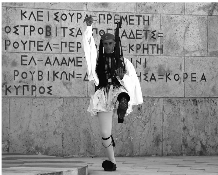
Зміна караулу Національної гвардії біля Могили невідомого солдата в Афінах

Інтерес переборює втому, адже ми нарешті в Афінах! Дістаємося до готелю в центрі міста (з кризою ціни з початком турсезону знизилися). Виходимо на