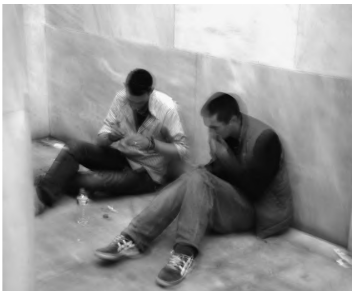
Наркомани в Національній бібліотеці?

А їх можна споглядати й удень: на одній вулиці з одного її боку марширують демонстранти, а іншого – відбувається звичний для мегаполіса