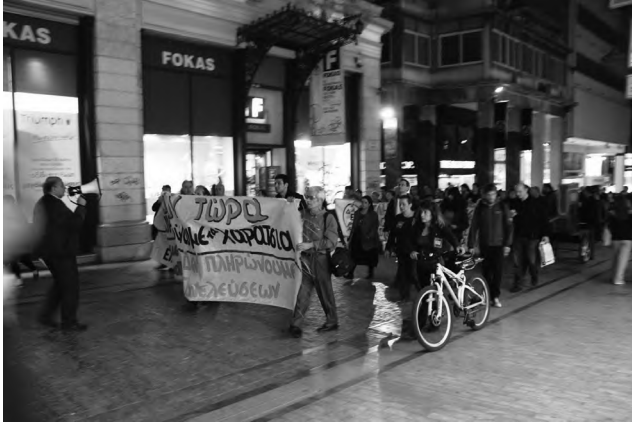
Демонстрації на вулицях Афін – звичне явище сьогодні грецької столиці

було непросто. Й не тому, що складно, а тому, що місцеві жителі направляли нас у різні боки – якась ахінея. (До речі, кажуть, що «ахінея» походить від імені «Афіни», зокрема храму Афіни. У давні часи освічені громадяни міста збиралися біля храму, щоби подискутувати. Щоправда, звичайні громадяни їх не особливо розуміли, тому й називали те, про що ті говорили, ахінеєю.) Зрештою, як з'ясувалося, в Афінах є грецька й римська Агора.