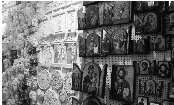
Сувеніри. Є, з чого обрати

Сувеніри? Як без них. Крім кулінарних, варто було взяти щось, як-то кажуть, і на довгу пам'ятку. Придбав кілька статуеток: для себе й для свого наукового вчителя з Інституту Корецького, професора В. Д. Бабкіна, придбав Сократа (саме образ цього філософа спав мені на думку, коли вперше