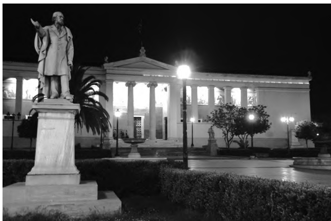
Афіський національний університет імені Каподистрії

що теж у Афінах, Університет Аристотеля в Салоніках – найбільший у Греції навчальний заклад, й, зрештою, Фракійський університет «Демокрит» в Камотіні. Найстарішим й найвідомішим є Афіський національний університет, започаткований 1837 року, зокрема й у складі юридичного факультету. Факультет у Салоніках відкрився у 1929-му, а в Камотіні – в 1974-му. За інформацією сайта Університету «Пантеон», право тут вважається післядипломним напрямом, а факультет наразі ще перебуває на етапі становлення. Започаткування ж цього університету пов'язують із іменем випускника юридичного факультету Афіського національного університету Георгіоса Франгоудіса (1869–1939), до речі, кіпріота. Цікаво, що на Кіпрі донедавна не готували юристів. Тому за освітою їхали до грецьких університетів чи навіть далі. Так само вчиняли, до речі, й самі греки, вступити на юридичний складно. Не легше й знайти роботу юристом.