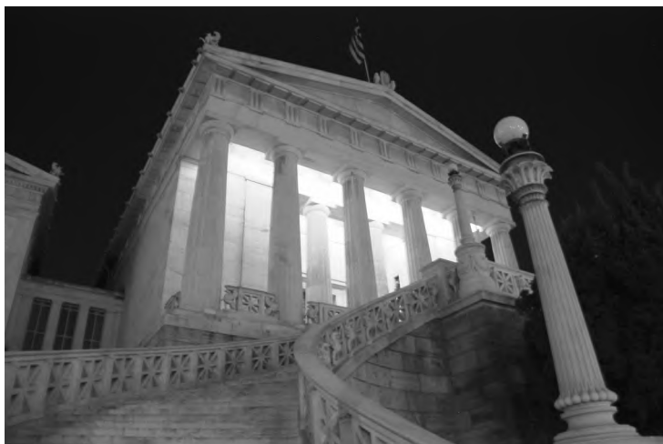
Нічний краєвид на Національну бібліотеку

зупинилися біля колиски перших сучасних Олімпійських ігор – стадіону Панатінайкос , що дослівно з грецької означає «прекрасний мармуровий». Його побудовано з білого мармуру коштом багатого грека Евангеліса Запаса. Саме тут 1896 року відбулися перші Ігри. Їх ініціатор – француз П'єр де Кубертен – запропонував відродити олімпійську традицію як міжнародну. Хоча мотиви, як пишуть, були й інші: покращити фізкультуру французів, низький рівень якої той вважав однією з причин поразки у франко-пруській війні 1870–1871 років. Заміною поля битви на стадіон він пропонував долати й національний егоїзм. Цікаво, що подібні ігри були відроджені раніше й проводилися за підтримки багатих греків: у них брали участь спортсмени з Греції та Оттоманської імперії, а сама подія одними сприймалася як кузня визвольного духу, а іншими – як форма його мирної сублимації. Яка, до речі, є й у центрі сучасних Афінів.