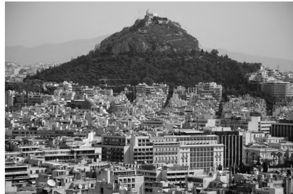
Сучасні Афіни – вид із Акрополя

Афіни, де мешкає третина 11-мільйонного населення Греції, ми почали пізнавати з оглядової екскурсії містом. Гід – симпатична грецька жінка середніх років вирізнялася відмінною англійською. І, як видалося з кількох речень про кризу, нелегальних мігрантів і грецьку діаспору в США, належністю до критично мислячого середнього класу.