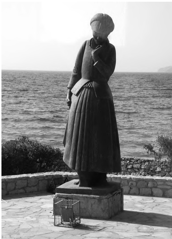
Пам'ятник матері на острові Егіна

свідчать: в 30-тисячному Монако чоловіки живуть в середньому 86, а жінки – 94 роки. Але й від Монако до Греції недалеко. Тож цікаво було пізнати й грецький розпорядок.