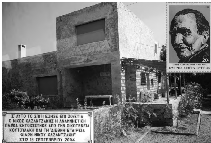
Будинок Н. Казандзакіса на Егіні

«Дерева життя» – ще одна цікавинка острова. Проїжджаючи повз них, ми й приїхали на фісташкову фабрику. Цікаво, що у давні часи, наприклад, у Персії фісташки вважали символом багатства.