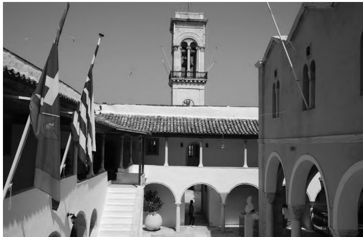
Монастир Успіння Богородиці на острові Гідра

станції «Монастиракі», поблизу афінської Агори та жвавого району Плаки. Обходимо сам Акрополь, що на горі. Ось і готель. Чи не одразу вибираємося на його дах, щоби помилуватися нічним краєвидом. Перед нами – Акрополь. Розвалини старого міста водночас зачаровують і розчаровують. Інтрига пізнання набирає обертів. Зростає й подальший інтерес.