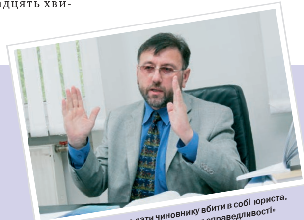
«Порада одна: не дати чиновнику вбити в собі юриста. Індикатор – наявність відчуття справедливості»