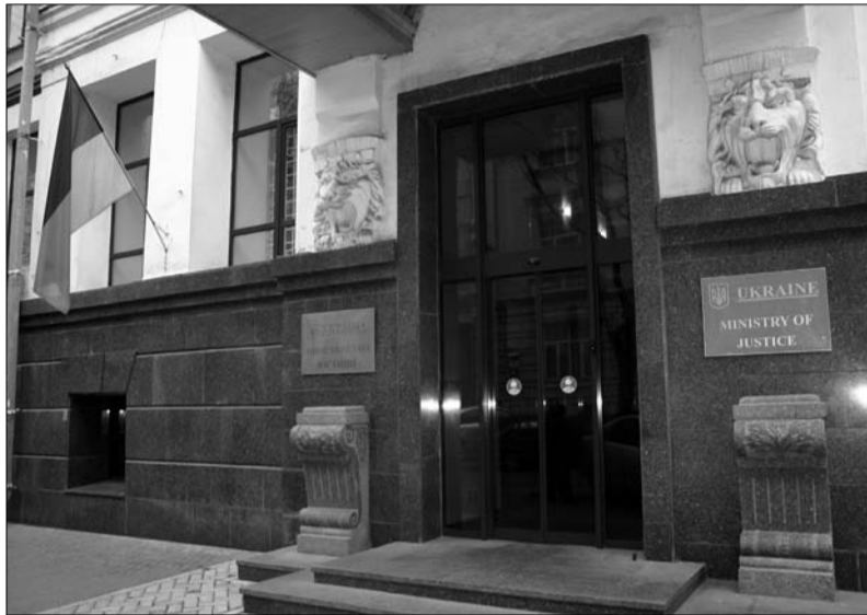
Будинок Міністерства юстиції України, м. Київ, провулок Рильського

Словом, Микола Оніщук – найбільш реальний претендент на посаду з огляду на політичні чинники. Але ще залишаються чинники професійні. Їх ми залишимо на розсуд юридичної громадськості.