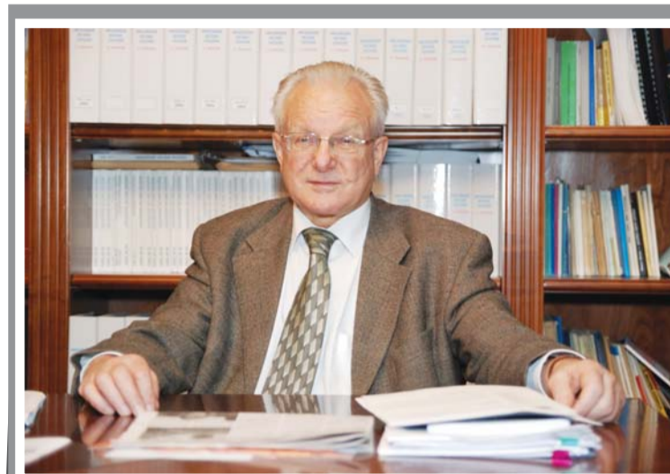
«Я працював з повною віддачею. І вся команда так працювала, попри те, що в команді були й іноземні громадяни. Ми потужно працювали»

діяльності на острові. Але це аж ніяк не означає, що статус острова змінився. Острів як був островом, так і залишився. Він на жоден квадратний сантиметр не зменшився і не збільшився.