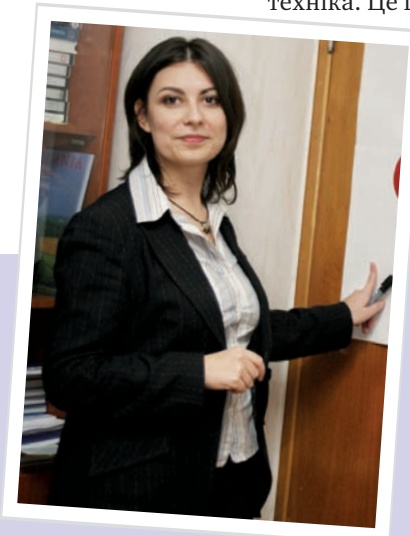
Відновне правосуддя – це процес, за допомогою якого сторони, втягнуті у злочин, спільно вирішують, як поводитися з його наслідками і які висновки зробити на майбутнє