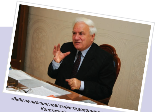
«Якби не вносили нові зміни та доповнення в 2004 році, Конституція могла би діяти»