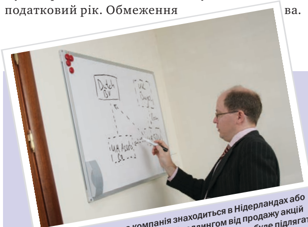
... якщо холдингова компанія знаходиться в Нідерландах або на Кіпрі, прибуток, отриманий холдингом від продажу акцій українських дочірніх підприємств, як правило, не буде підлягати оподаткуванню в Україні ...