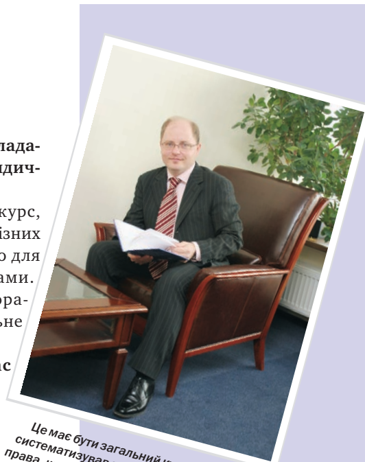
Це має бути загальний курс, який би систематизував знання в різних галузях права, що конче важливо для розуміння та роботи з M&A угодами. Цей курс мав би включати корпоративне, податкове та антимонопольне право.