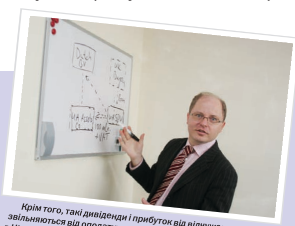
Крім того, такі дивіденди і прибуток від відчуження акцій звільняються від оподаткування на рівні холдингової компанії в Нідерландах чи на Кіпрі відповідно до положень внутрішнього податкового законодавства цих країн.