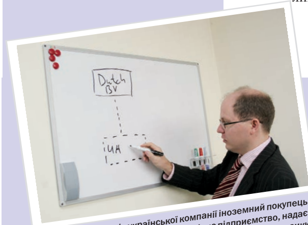
При купівлі активів української компанії іноземний покупець, як правило, засновує в Україні дочірнє підприємство, надає йому кошти у вигляді внеску до статутного фонду або позики для купівлі українських активів. Активи купуються дочірнім підприємством...