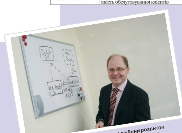
Моє професійне кредо – професійний розвиток та бездоганна якість обслуговування клієнтів.