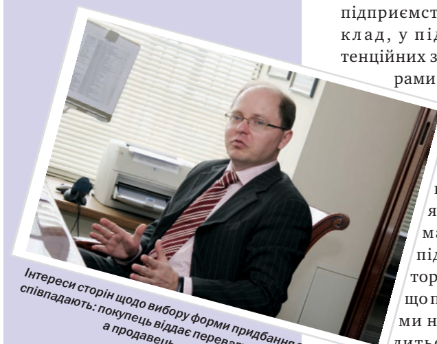
Інтереси сторін щодо вибору форми придбання зазвичай не співпадають: покупець віддає переваги придбанню активів, а продавець – продажу акцій.