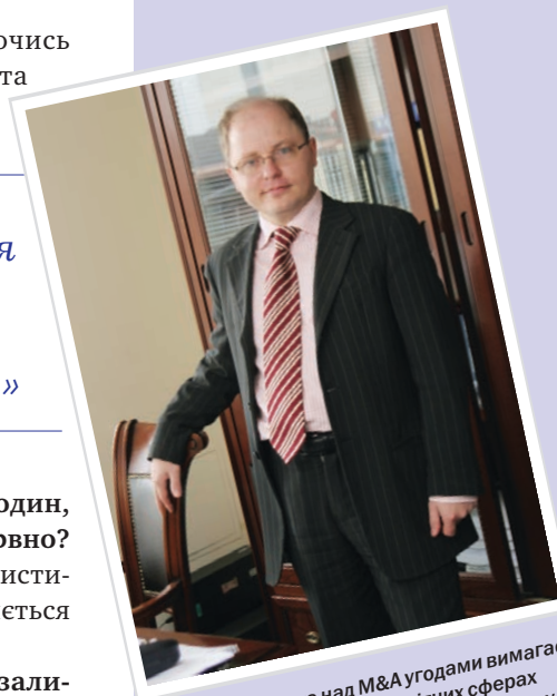
Оскільки робота над M&A угодами вимагає обізнаності у різноманітних сферах законодавства, юристи, котрі працюють у цій галузі, M&A юристи мають можливість постійно розвиватися і вдосконалювати власні знання в різних галузях права.