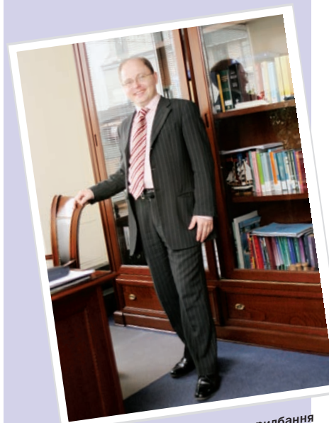
Вибір тієї чи іншої форми придбання залежить як від податкових, так і від неподаткових чинників.