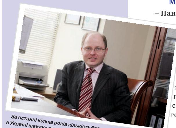
За останні кілька років кількість багатомільйонних M&A угод в Україні швидко зростає. Йдеться, насамперед, про придбання іноземними корпораціями значних українських активів у промисловості, банківській та страховій сферах, у сільському господарстві.

– Які «холдингові юрисдикції» і чому є найбільш сприятливими при інвестуванні в Україні?