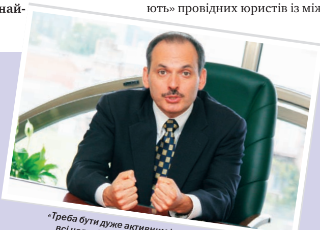
«Треба бути дуже активним і використовувати всі наявні джерела для отримання знань»