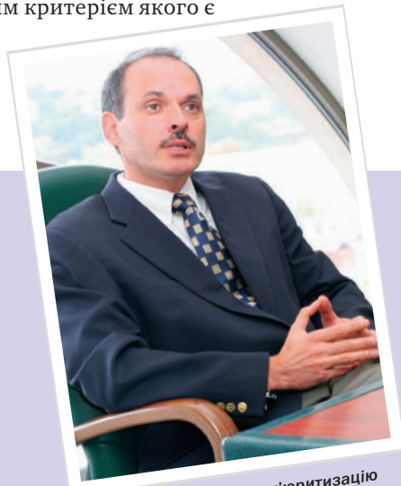
«Я б виділив ІРО та сек'юритизацію як найближчу перспективу»

– Змінилося досить багато. Насамперед, неймовірно зростає мобільність. Я добре пам'ятаю часи, коли основним способом швидкої відправки документів був факс і секретарі змушені були проводити години біля факсів, відправляючи великі за обсягом документи. Сучасні