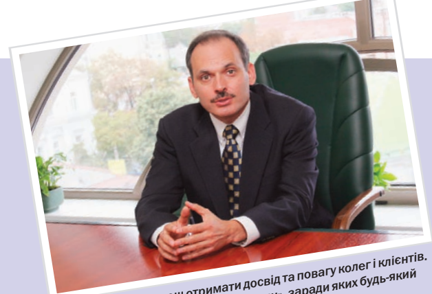
«... від роботи можеш отримати досвід та повагу колег і клієнтів. Останнє і є тими «аплодисментами», заради яких будь-який фахівець виходить на сцену своєї справи»