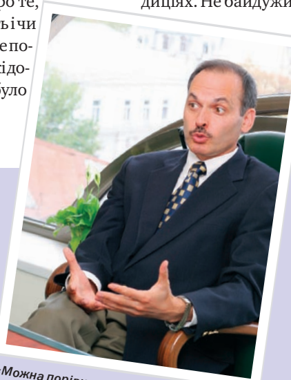
«Можна порівняти юрбізнес з тенісом або шахи. В обох видах спорту найвищим досягненням є найкращий рейтинг та кількість виграних турнірів»