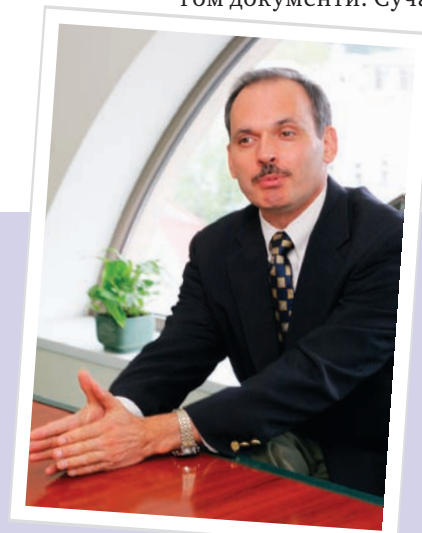
«... піддавай сумніву так звані «очевидні істини». Я на власному досвіді переконався, що таких не існує...»