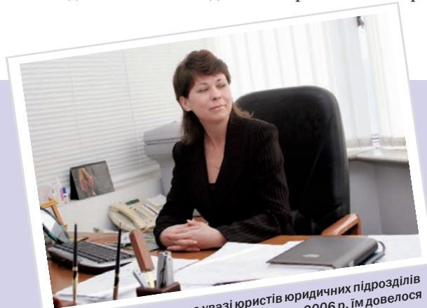
Загалом, якщо мати на увазі юристів юридичних підрозділів податкових органів м. Києва, упродовж 2006 р. їм довелося брати участь у розгляді в судах 12 065 справ.

– У справі, мабуть, йшлося про зловживання?