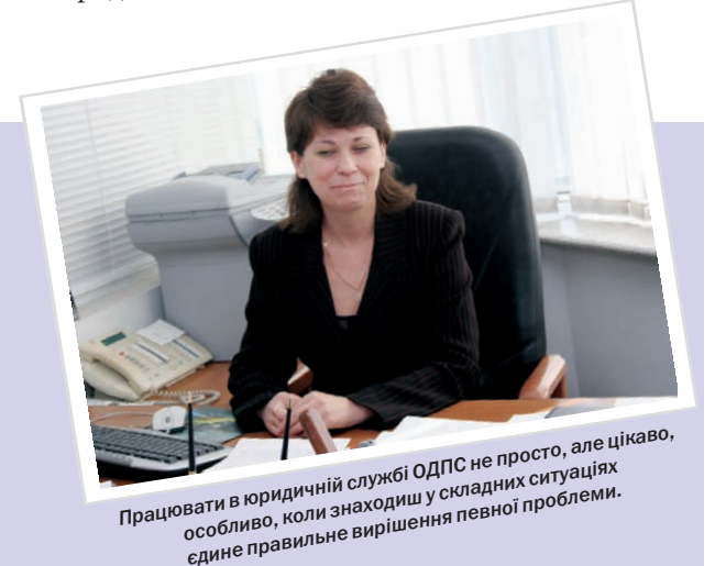
Працювати в юридичній службі ОДПС не просто, але цікаво, особливо, коли знаходиш у складних ситуаціях єдине правильне вирішення певної проблеми.