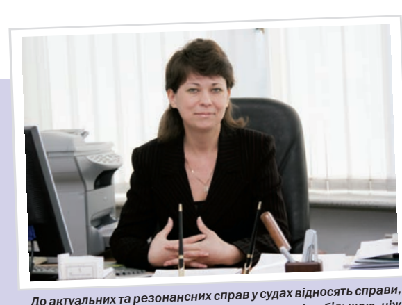
До актуальних та резонансних справ у судах відносять справи, в яких сума позовних вимог платників податків є більшою, ніж 1 млн грн та справи, розгляд яких носить резонансний та суспільно важливий характер.