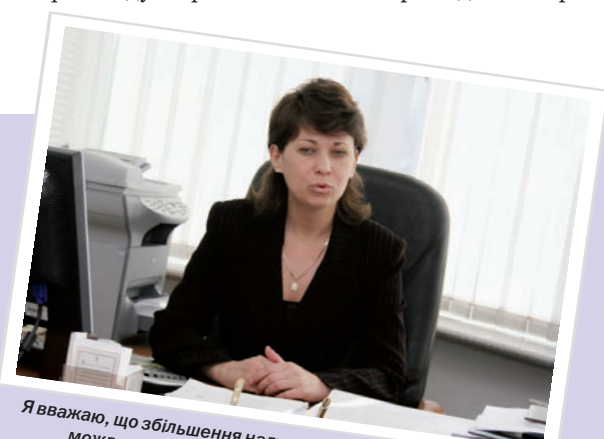
Я вважаю, що збільшення надходжень платежів до бюджету можливе за рахунок підвищення добровільності сплати податків.